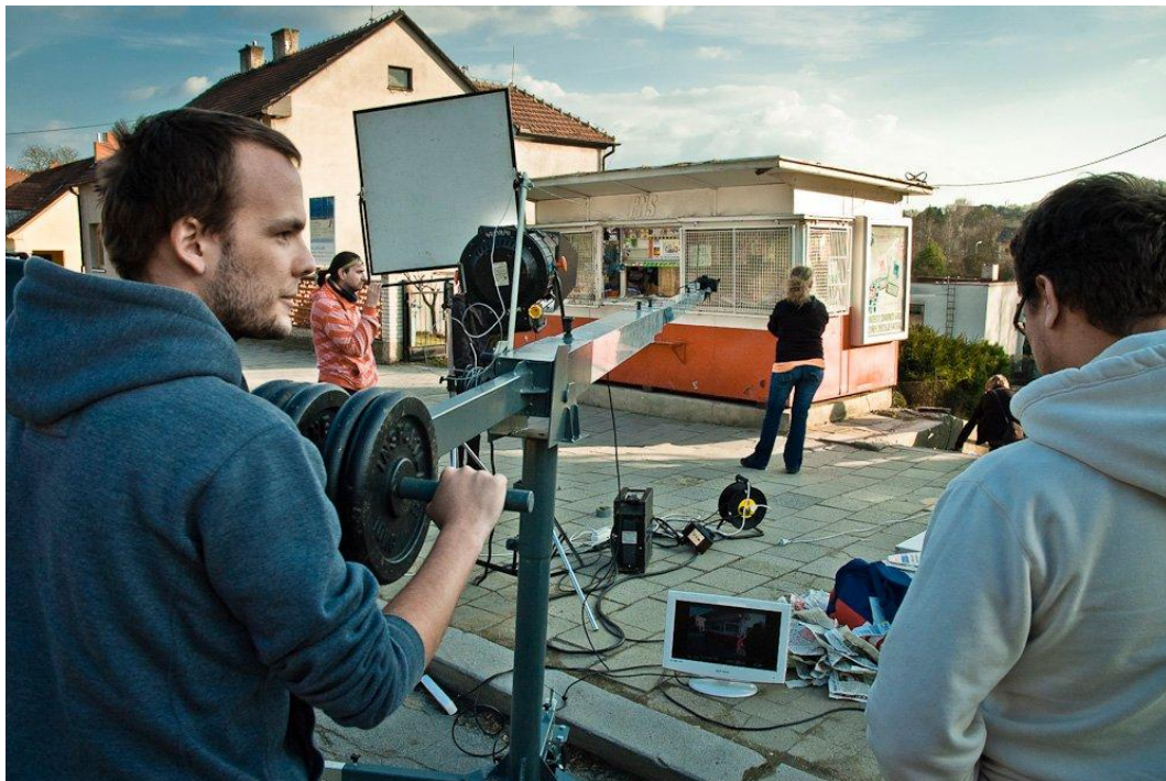
Prototyp kamerového jeřábu v akci